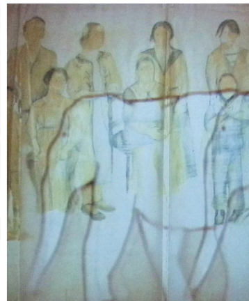
© Claudia Losi, Sabah Naim, Avish Khebrehzadeh

Il convegno Dal terzomondismo al postcolonialismo: immaginari visivi attorno a multiculturalismo, (anti)razzismo e neoprimitivismo in Italia (1979-2009) si colloca nell'ambito del Progetto di Ricerca di Ateneo della Sapienza Università di Roma focalizzato sulla fase storica compresa tra il declino del terzomondismo – la fine degli anni Settanta – e l'emergenza di una esplicita sensibilità postcoloniale nella seconda decade del XXI secolo. In un periodo di profonde trasformazioni geopolitiche, l'Italia, tradizionale paese di emigrazione, diventa meta di flussi migratori dall'Europa dell'Est, dall'Asia e dall'Africa: un fenomeno che trova gli attori sociali e politici impreparati e che suscita reazioni razziste, per certi aspetti in linea con il mancato dibattito sul colonialismo.