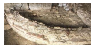
15. Struttura muraria B Terme di Carsulae

Si sono altresì conclusi i lavori della facciata di San Francesco, compreso il dipinto murale posto nella nicchia