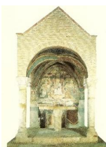
3. Madonna in trono con Bambino (San Carlo)