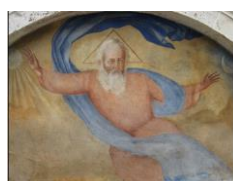
11. Lunetta con affresco Chiesa del Duomo