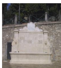
6. Fontana monumentale Piazza San Francesco