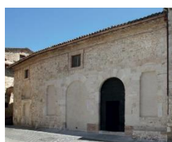
14. Facciata S.M. de Incertis (San Carlo)