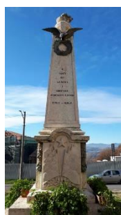
12. Monumento ai caduti