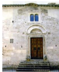
7. Portale cosmatesco San Giovanni Battista