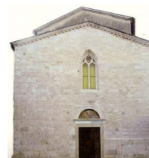
10. Facciata Chiesa del Duomo