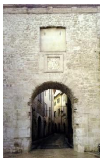
13. Porta Burgi Piazza San Francesco