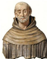
9. Busto San Bernardino Chiesa San Francesco